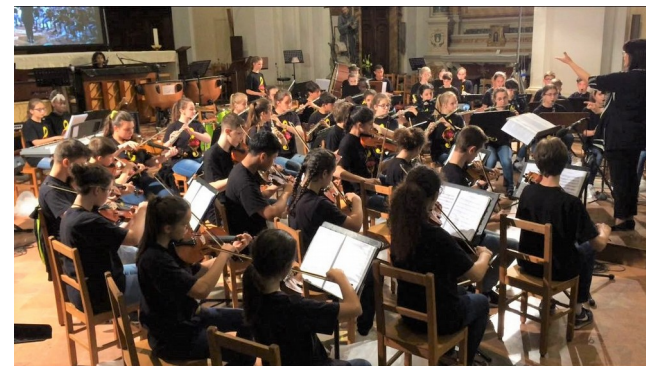
I premio assoluto al Concorso Nazionale "Zangarelli" di Città di Castello 2018