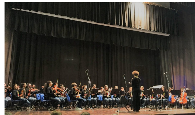
Concerto di fine anno e premiazioni delle borse di studio al "Teatro Remondini"

"Il suono musicale ha accesso diretto all'anima e vi trova subito una risonanza, poiché l'uomo ha la musica in sé stesso"